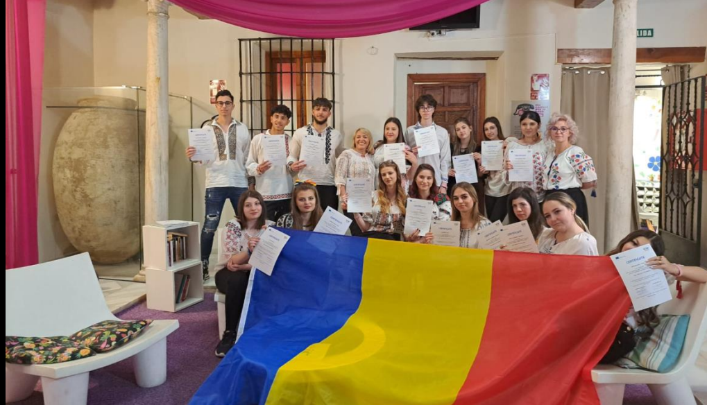
Inmanarea certificatelor de participare la curs