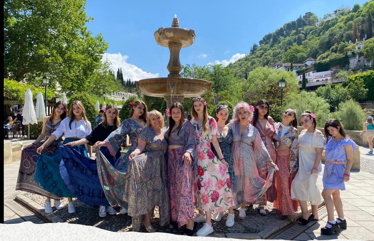
Cartierul arăbesc Albaicin