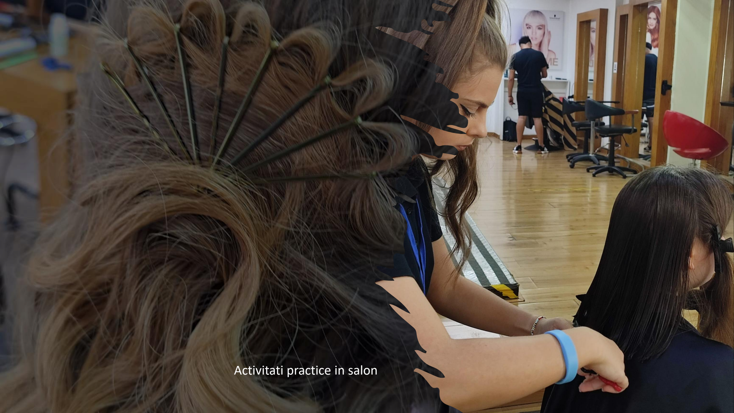
Activitati practice in salon